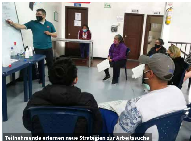
Teilnehmende erlernen neue Strategien zur Arbeitssuche

Der YMCA hat die Familien außerdem mit Lebensmitteln und Zugang zu sanitären Anlagen unterstützt. Was Bildung und Gesundheit betrifft, so konnten Jungen und Mädchen an das formale Bildungssystem herangeführt und drängende Gesundheitsprobleme angegangen werden. Zusätzlich wurden von der YMCA-Zentrale aus die technischen Mittel zur Verfügung gestellt, um die Kontinuität der Schulbildung zu gewährleisten und Schulabbrüche zu verhindern, da aufgrund der Pandemie der Unterricht virtuell durchgeführt werden musste.