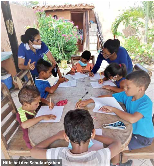
Hilfe bei den Schulaufgaben