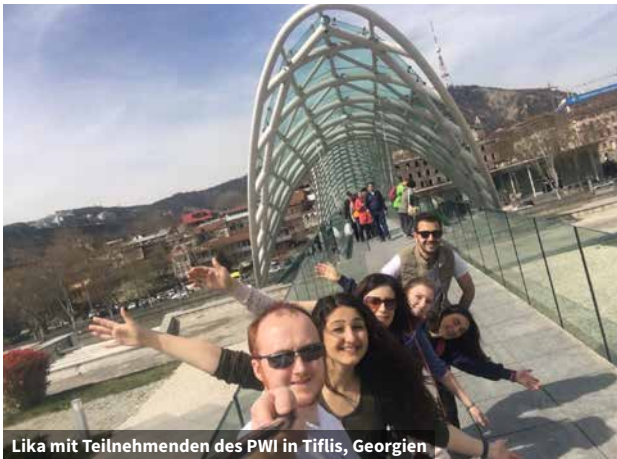
Lika mit Teilnehmenden des PWI in Tiflis, Georgien

Der YMCA ist immer an ihrer Seite und hilft den Teilnehmenden, auch weiterhin zu wachsen und sich zu Fachleuten auszubilden, die diese guten Ideen in die Zukunft tragen.