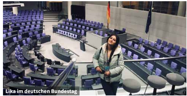
Lika im deutschen Bundestag