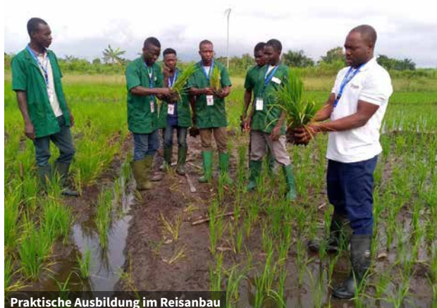
Praktische Ausbildung im Reisanbau

Aufgrund dieser Situation, und nach einer 2013 durchgeführten Analyse zur Ermittlung des Ausbildungsbedarfs von jugendlichen Schulabgängern, hat der YMCA Togo