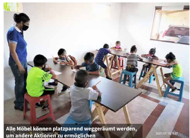
Alle Möbel können platzsparend weggeräumt werden, um andere Aktionen zu ermöglichen

einen Eindruck von den sozialen Risiken der Kinder und Jugendlichen in diesen Gemeinden gewonnen. Wir fanden heraus, dass die meisten Kinder schon vor der Pandemie die Schule abgebrochen hatten. Ihnen fehlten die finanziellen Mittel um Schulmaterial, Uniformen oder Pausenbrote zu kaufen. Viele dieser Kinder wurden in die Obhut von Großeltern und anderen Verwandten abgegeben oder sind Kinder von alleinstehenden Müttern. Ihre Eltern sind auf der Suche nach Arbeit und einer Überlebenschance aus dem Land geflohen. So gibt es unendlich viele Familien, die durch das erzwungene Exil von mehr als fünf Millionen Venezolanern auseinandergerissen wurden.