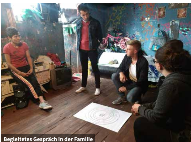
Begleitetes Gespräch in der Familie