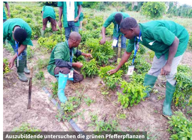
Auszubildende untersuchen die grünen Pfefferpflanzen

Das Zentrum unterhält sehr gute Beziehungen zu den lokalen und staatlichen Behörden. Ein Beweis für die jüngste Zusammenarbeit mit der Regierung ist die Unterbringung und Ausstattung einer ersten Gruppe von fünfzehn jungen Unternehmern, die vom Ministerium für Basisentwicklung vermittelt wurde. CFER ist Mitglied des Netzwerks der landwirtschaftlichen Ausbildungszentren in Togo (APCFAR) und unterhält gute Beziehungen zur Ernährungs- und Landwirtschaftsorganisation der Vereinten Nationen (FAO) und zum Landwirtschaftsministerium.