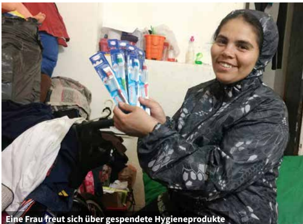
Eine Frau freut sich über gespendete Hygieneprodukte