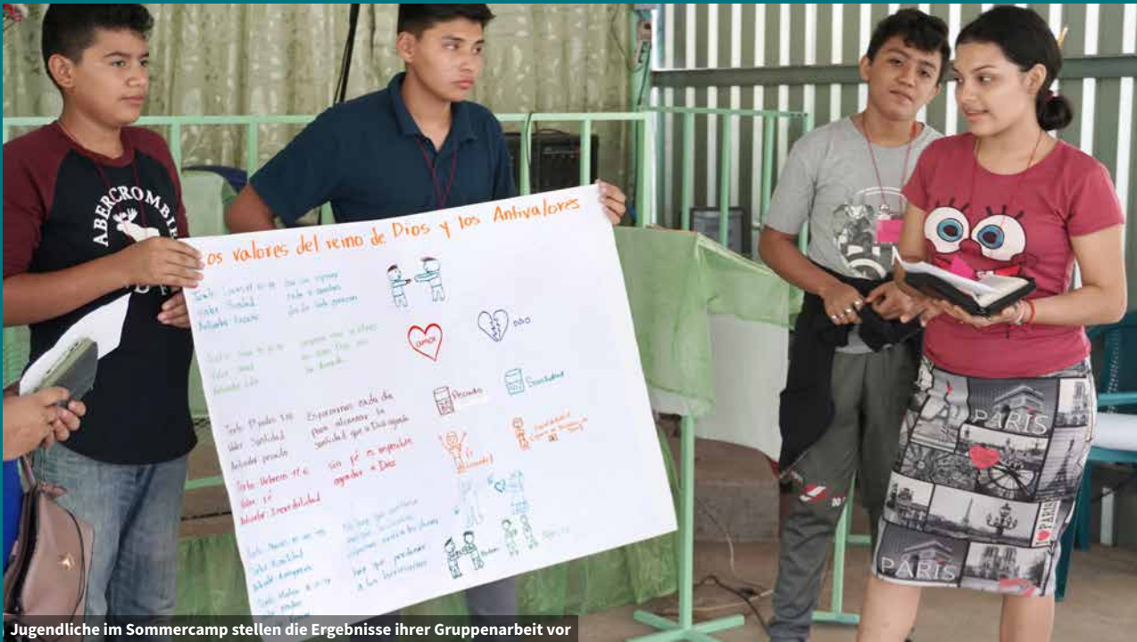
Jugendliche im Sommercamp stellen die Ergebnisse ihrer Gruppenarbeit vor