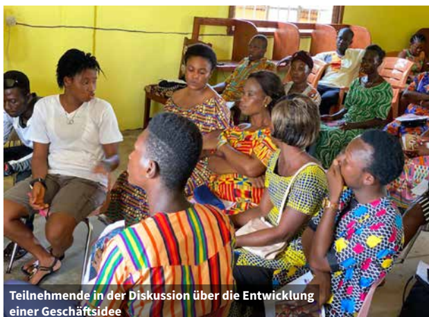
Teilnehmende in der Diskussion über die Entwicklung einer Geschäftsidee

Das Projekt zielt darauf ab, die Kapazitäten junger Menschen im Bereich der Unternehmens- und Beschäftigungsentwicklung zu stärken, indem ihre Fähigkeiten zur Entwicklung und Führung ihrer Unternehmen und zur Aufnahme einer Beschäftigung verbessert werden. Weitere Themen sind Fundraising und Lobbyarbeit, Musik und Kunst, psychosoziale Unterstützung und Informations- und Kommunikationstechnologie (IKT). Außerdem sollen die Fähigkeiten junger Menschen zur Bewältigung von Problemen während der Covid-19-Pandemie gesteigert werden.