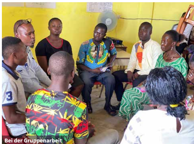
Bei der Gruppenarbeit

Mit einem weiteren zweitägigen Führungstraining mit Fundraising-Workshop wurde bei 50 Jugendlichen das Führungspotenzial gestärkt und sie wurden in die Lage versetzt, Führungsrollen und -aufgaben zu übernehmen. Die Schulung integrierte das YMCA-Thema „aktive Bürger“ (From subject to citizen) und vermittelte Konzepte zu aktiver Bürgerbeteiligung und staatsbürgerlicher Bildung. Im Rahmen des Projekts wurde auch ein Computerschulungszentrum eröffnet.