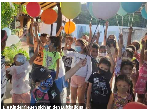
Die Kinder freuen sich an den Luftballons

Wie wird sich unser Projekt auf die Lebensqualität der Teilnehmenden auswirken? Die Kinder und Jugendlichen können jeden Tag in unser „Haus der Hoffnung“ kommen. Wir unterstützen sie bei ihren Schulaufgaben und fördern,