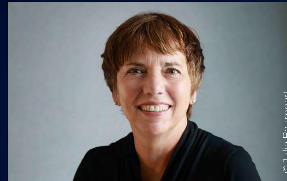
2. Glaube als Geschenk MARGOT KÄSSMANN